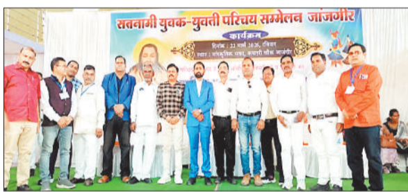
कार्यक्रम में मंचस्थ अतिथिगण।

सतनामी युवक-युवती परिचय सम्मेलन गरिमापूर्ण ढंग से सम्पन्न