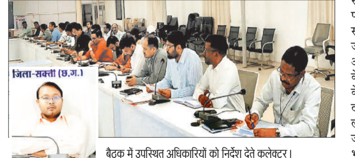
बैठक में उपस्थित अधिकारियों को निर्देश देते कलेक्टर।

कलेक्टर कार्यालय सभाक्ष में मंगलवार 24 मार्च को कलेक्टर अमृत विकास तोपनो ने साप्ताहिक समय सीमा की बैठक लेकर विभिन्न विभाग अंतर्गत चल रहे विभागीय कामकाज की समीक्षा की। बैठक में कलेक्टर श्री तोपनो ने जिले में सड़क सुरक्षा को लेकर आवश्यक निर्देश दिए। उन्होंने दुर्घटना संभावित क्षेत्रों में त्वरित सुधार कार्य कराने के निर्देश दिए। साथ ही अधिक दुर्घटना वाले स्थानों पर जागरूकता बोर्ड, रिप्लेक्टर एवं अन्य सुरक्षा संकेतक अनिवार्य रूप से लगाने पर जोर दिया। कलेक्टर ने संवेदनशील क्षेत्रों में सभी आवश्यक सुरक्षा व्यवस्थाएं सुनिश्चित करने को कहा। इसके साथ ही राष्ट्रीय राजमार्ग निर्माण कार्य में तेजी लाने